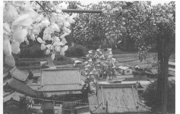
裏山はツツジに加え、フジも咲くようになりました。